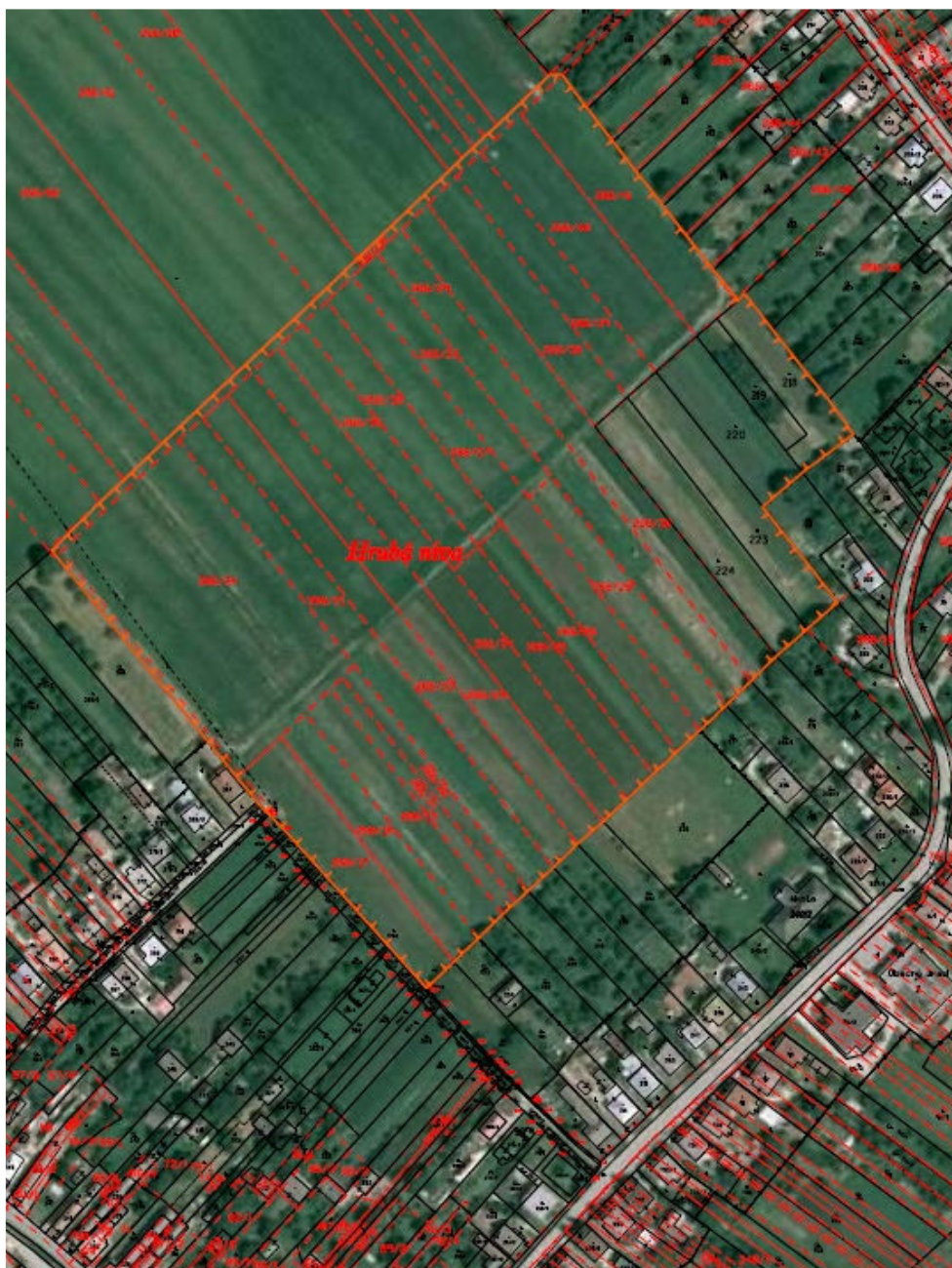
2) Zobrazenie územia s vyznačením obvodu JPÚ